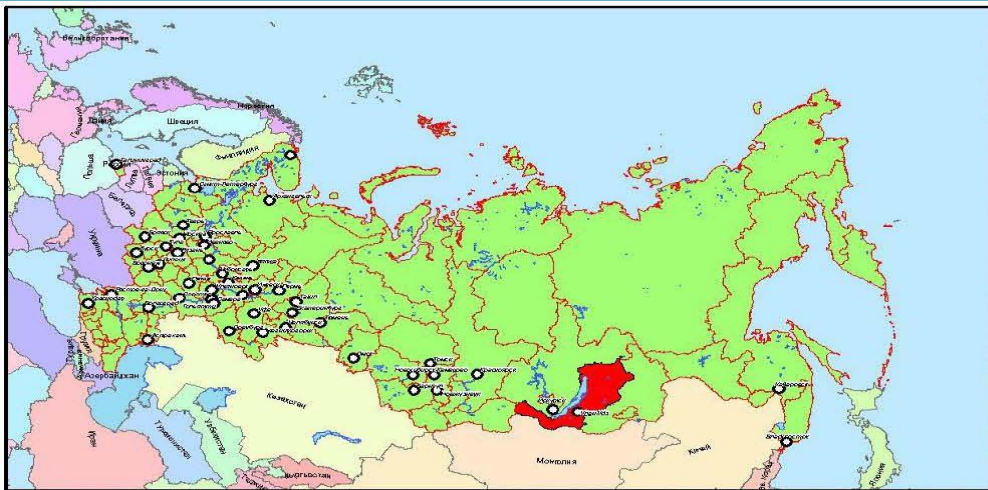
Схема расположения ТР ОЭЗ

Местоположение ТР ОЭЗ "Ворота Байкала" Иркутская область