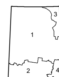
СХЕМА ПОЛИТИКО-АДМИНИСТРАТИВНОГО ДЕЛЕНИЯ