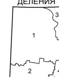
СХЕМА ПОЛИТИКО-АДМИНИСТРАТИВНОГО ДЕЛЕНИЯ